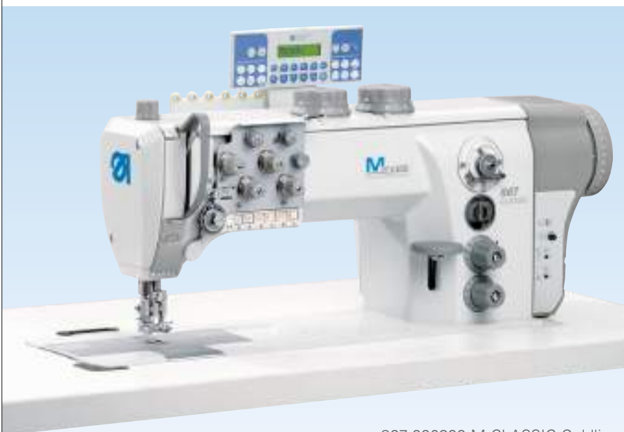
867-290322-M CLASSIC Goldline