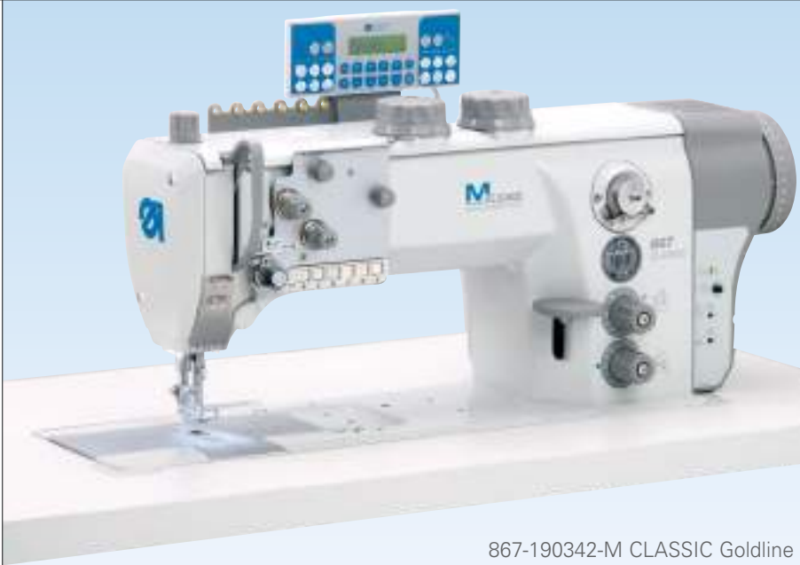
867-190342-M CLASSIC Goldline

Die leistungsstarken Unterklassen / The highly efficient subclasses