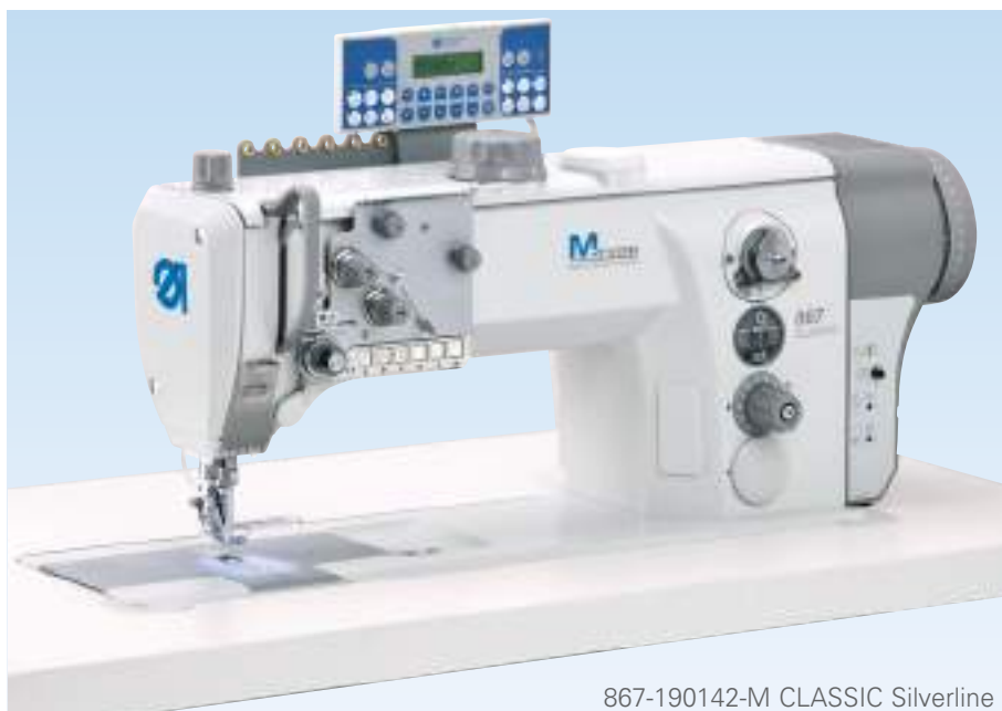
867-190142-M CLASSIC Silverline