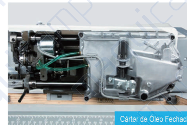
Cárter de Óleo Fechado

O sistema do corte de linha mantém-se o mesmo dos modelos A4S e A5, que oferecem um corte de linha, com o tamanho de linhas na casa dos 3.5mm.