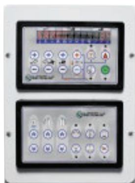
CONSOLE COMANDI CONTROL PANEL